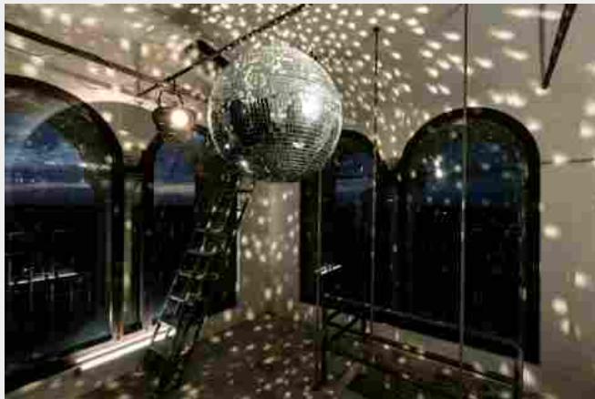
Francesco Pedrini, Planetes (errante), 2016

surreale enigmatico, per fruizione individuale, ospitato al centro del cortile d'onore di Palazzo dei Pio.