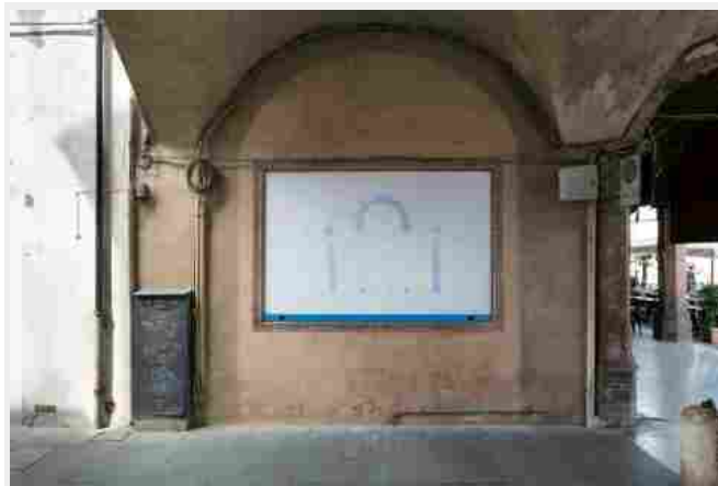
Giuseppe De Mattia, Madri , 2016 – courtesy Musei di Palazzo dei Pio, Carpi – photo Roberto Marossi